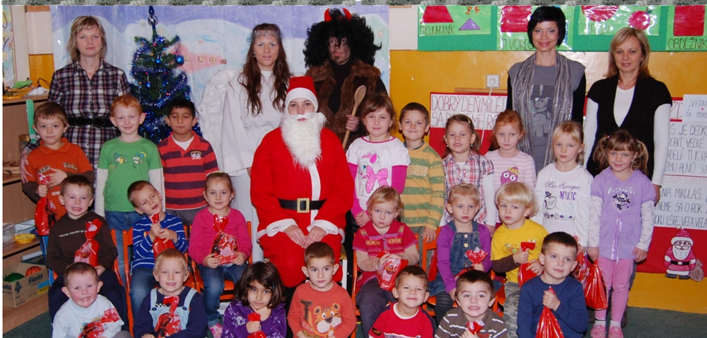
6.12. 2011 sme privítali v našej materskej škole Mikuláša, pripravili sme mu pekný program, plný básní, piesní. Mikuláš nás pochválil, že sme šikovní a odmenil nás sladkým balíčkom.